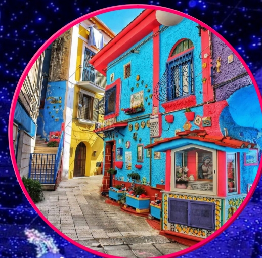
Vietri sul mare