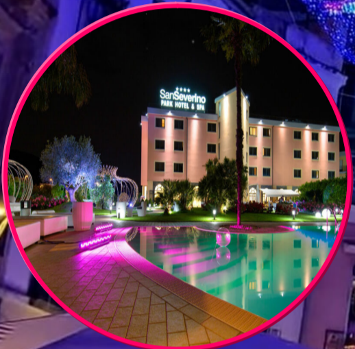
Park Hotel ****